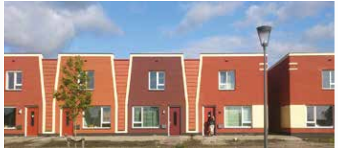
16 woningen volgens het Ewoning-principe in Hasselt