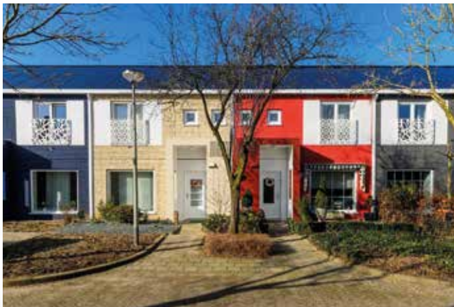
Project van Volker Wessels, een prototype van de Stroomversnelling