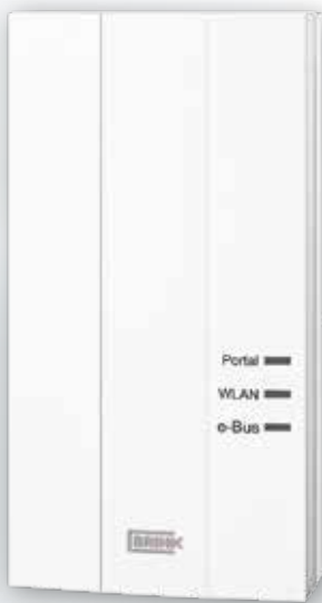
Brink Home Module

Brink Home bestaat uit de Brink Home Module en de Brink Home App, die gekoppeld zijn met de Renovent eventueel voorzien van de bedienmodule Air Control. De Brink-toestellen in de Renovent-serie zijn hiermee via een (W)LAN-router of de Brink-Portal-Server bereikbaar. De Brink Home App voor smartphone en tablet is beschikbaar in Android en iOS.