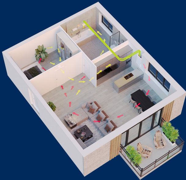
Appartement de 2 pièces avec Ease 100 comme ventilation semi-centralisée (dans le mur) avec un brasseur d'air.