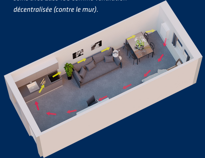
Chambre d'étudiant ou maison de soins avec Ease 100 comme ventilation décentralisée (contre le mur).