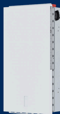
Ease 100 E in wall