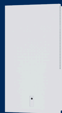
Ease 100 E on wall