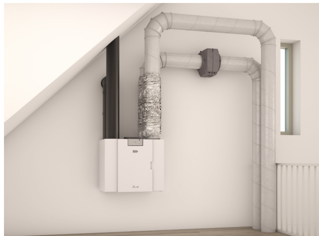
Door de Evap Pro te installeren in het kanaal van het ventilatietoestel naar de woonruimtes, wordt het een onderdeel van het ventilatiesysteem.

Wanneer een woning al is uitgerust met een ventilatiesysteem met enthalpiewisselaar, maar dit nog steeds niet voldoende is, kan de Evap Pro ook als extra bevochtiger worden toegepast. Dit is vooral relevant voor landen waar de temperatuur extreem laag kan zijn, zoals -15^{\circ}\text{C} in de winter. Ook in mildere klimaten en bij toepassing van een ventilatiesysteem met standaard warmtewisselaar kan de Evap Pro uitstekend worden toegepast. De Evap Pro kan ook worden gecombineerd met de systeemmodule Evap Air Cooler: een slimme extra aanvulling op het WTW-systeem voor ook afgekoelde lucht in de zomer. Met deze combinatie is een optimaal binnenklimaat in elk seizoen gegarandeerd.