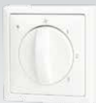
Standenschakelaar met filterindicatie

De standenschakelaar is voorzien van een signallampje voor filterindicatie. Dit lampje geeft aan wanneer de filters schoongemaakt moeten worden.