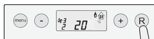
Display Allure luchtverwarmer

Wanneer deze filtermelding verschijnt, wordt geadviseerd het filter in te luchtverwarmer schoon te maken, respectievelijk te vervangen. Na reinigen/vervangen van het filter kan men de filtermelding op het display van de Brink eBus klokthermostaat laten verdwijnen door gedurende 5 seconden op de "Reset"-knop ('R'-toets) op het bedieningspaneel van de Allure luchtverwarmer te drukken.