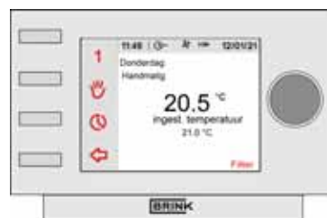
Display Brink eBus klokthermostaat

Op het display van de Brink eBus klokthermostaat zal na bepaalde interval de melding "Filter" in beeld verschijnen.