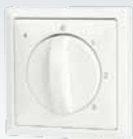
Stufenschalter mit Filteranzeige