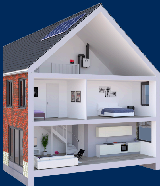
Ease 200 toegepast op zolder in een kleine rijwoning.