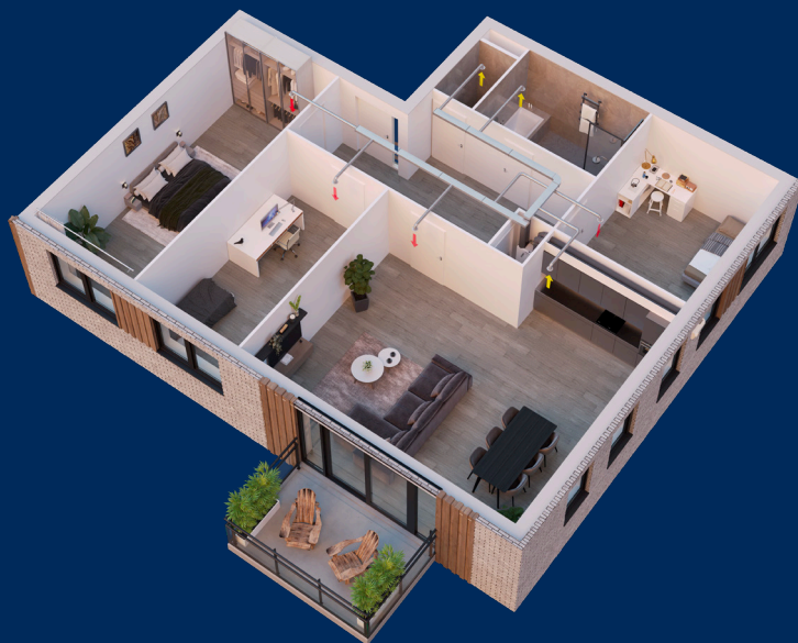
Ease 200 toegepast in een appartement.

De Ease 200 is vanwege de compacte afmetingen uitermate geschikt voor projectmatige nieuwbouw zoals sociale huurwoningen maar ook voor duurzame renovatie van bestaande woningen. De Ease 200 met enthalpiewisselaar heeft als aanvullend voordeel dat er geen condensafvoer nodig is waardoor het toestel achteraf makkelijk in een woning te installeren is (zie installatievoorschrift). Wanneer de Ease 200 in combinatie met het innovatieve Multi Air Supply systeem wordt toegepast, zijn er geen toevoerkanalen naar de ruimtes nodig. Hiermee bespaar je flink op bouwkundige kosten.